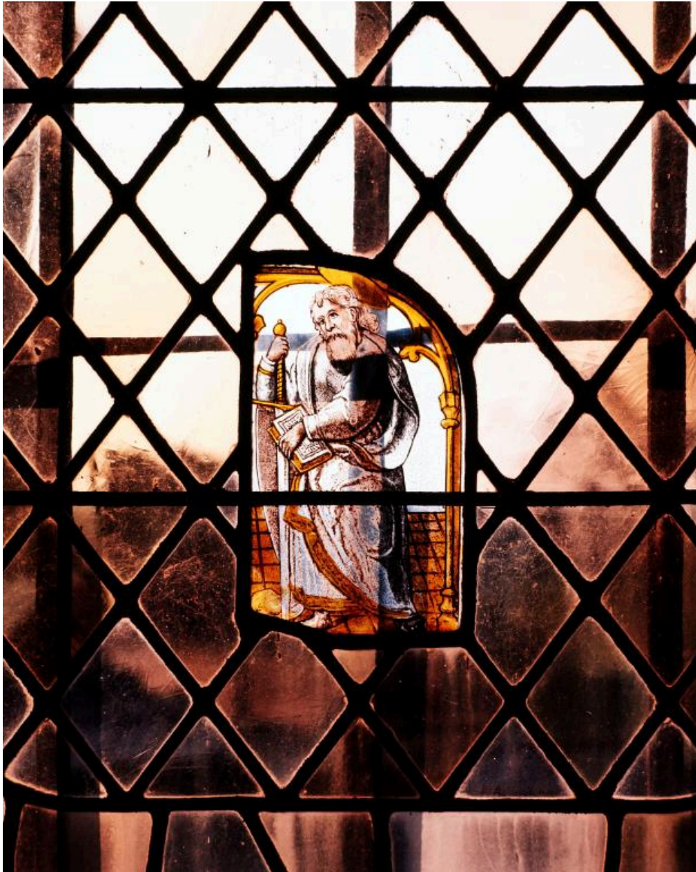
Saint Paul, détail. (1977).