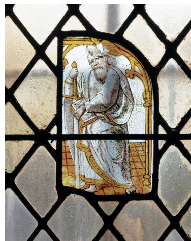
Saint Paul, détail.