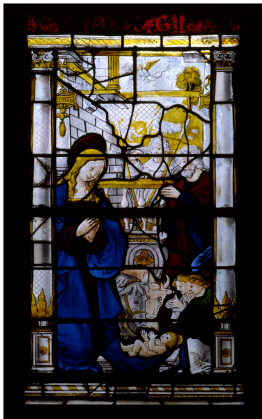
Nativité, détail