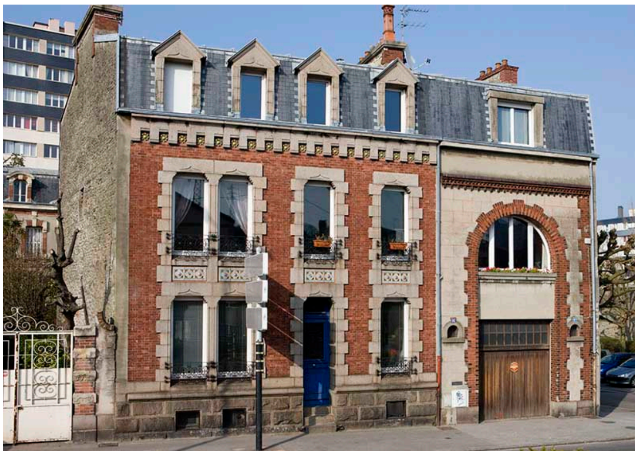
Façade sur rue.