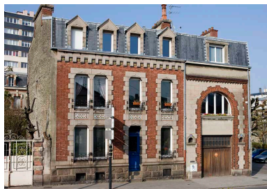
Façade sur rue. IVR25_20095000525NUC2A