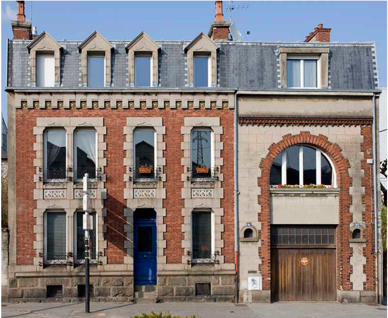
Façade sur rue.