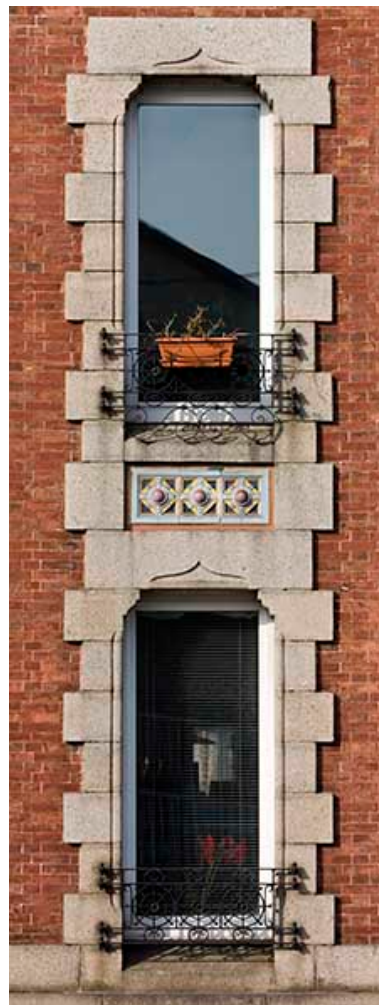
Façade sur rue. Détail d'une travée.