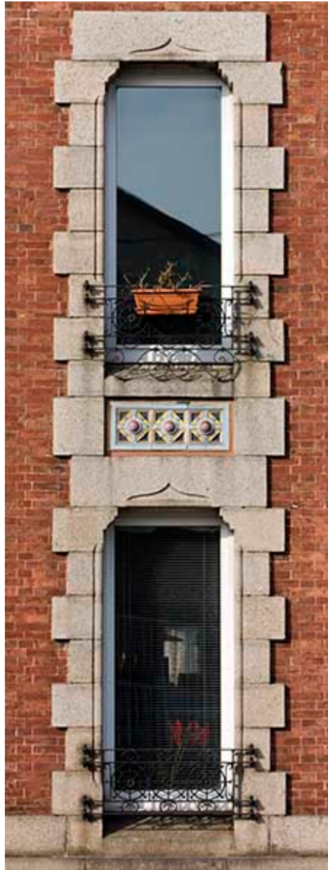
Façade sur rue. Détail d'une travée.