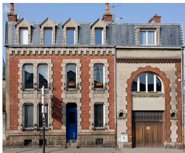
Façade sur rue.