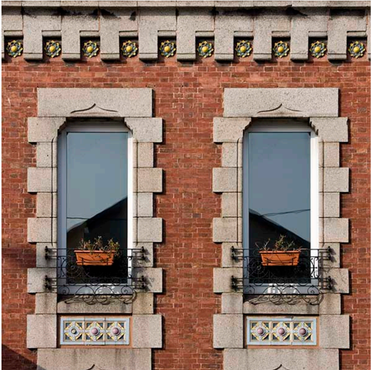
Façade sur rue. Détail des baies du premier étage.